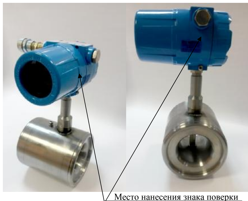
Рисунок 2 – Датчик расхода «DYMETIC-1204M-Г»