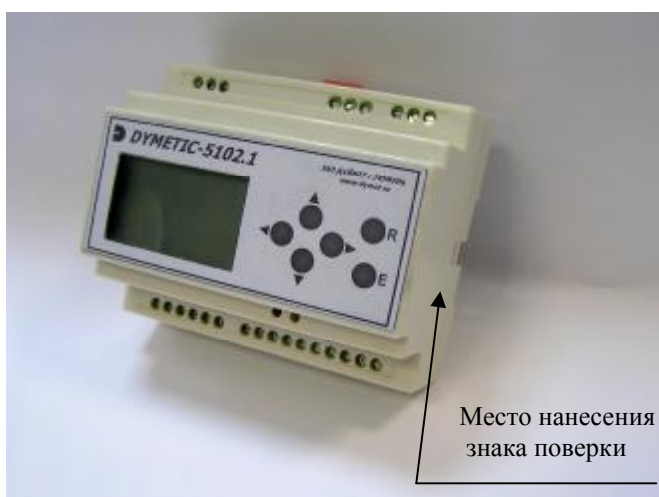
Рисунок 2 – Общий вид вычислителя «DYMETIC-5102.1»